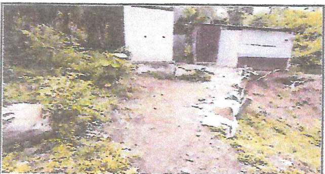
Foto 3: Sanitarios y puertas en mal estado a un costado del centro educativo, así mismo se encuentran en peligro de desborde.