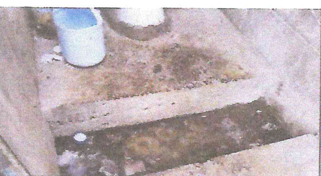
Foto 6: Condición interna de los sanitarios, sanitarios quebrados y derrame de agua por accesorios en mal estado

Observación: Si es necesario se pueden agregar hojas adicionales y actualizar el número de hojas.