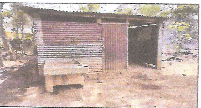
Foto 5: Vista exterior de la cocina del centro educativo así mismo la pila en mal estado.