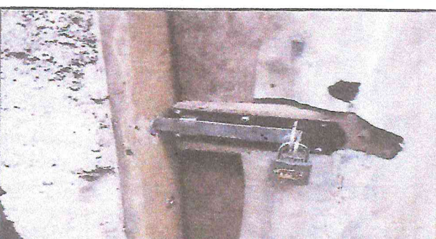
Foto 4: Puertas de lámina y madera, y cerraduras inseguras en los sanitarios